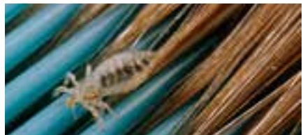
Hoofdluis op een kam.